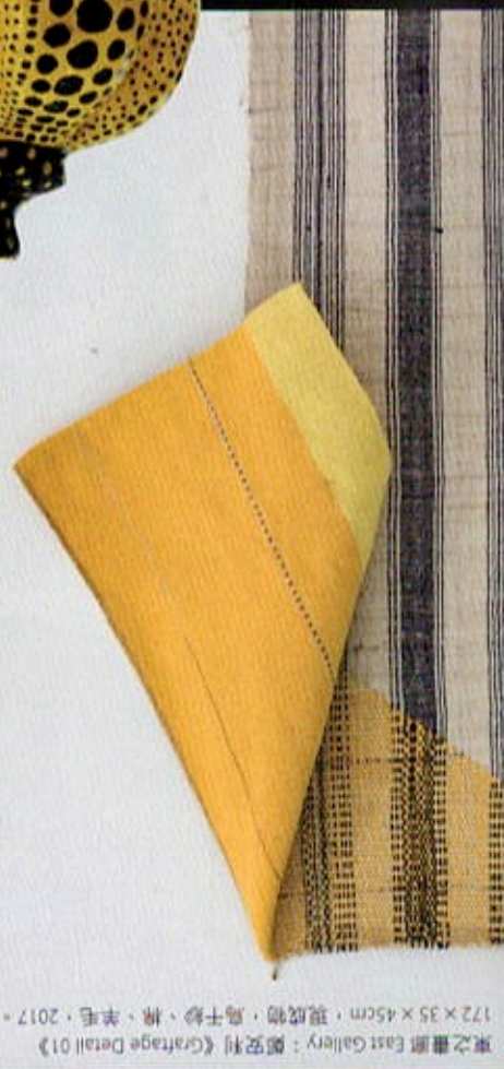
東之畫廊 East Gallery：鄭安利《Graftage Detail 01》 172 x 35 x 45cm · 現成物、馬千紗、麻、羊毛 · 2017 ·