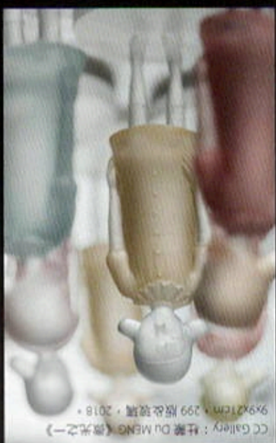
CC Gallery：杜蒙 Du MENG 《微光之一》 9x9x21cm · 299 版玻璃 · 2018 ·