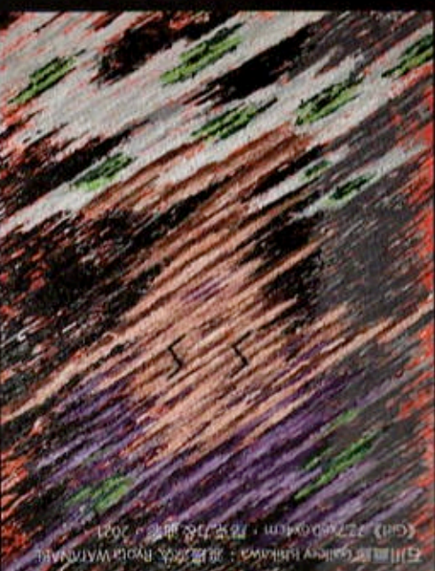
石川画廊 Gallery Ishikawa：渡邊涼太 Ryota WATANABE 《Girl》27.2x26.0x4cm · 厚塗力克油畫 · 2021 ·